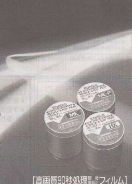
【高画質90秒処理フィルム】