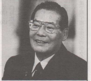
日本対がん協会常務理事で、国立がんセンター名誉院長でもある市川平三郎先生が、今年度のレントゲン賞を受賞、去る四月十七日、先生が招かれドイツのレントゲン市で授章式があった。

発行所 日本消化器集団検診学会 関東甲信越地方会 〒170-0001 東京都豊島区西巣鴨1-9-3 井合ビル1F 発行兼 関東甲信越地方会 編集者 編集委員会